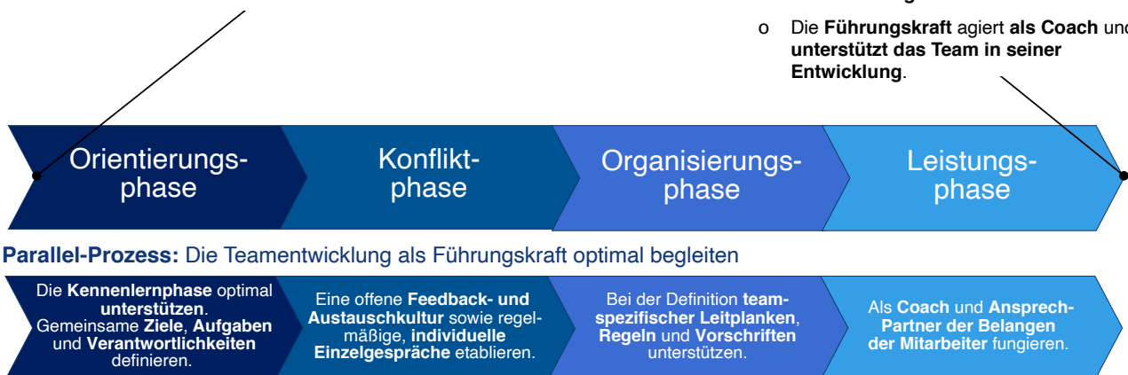
Abb. 1: Die Teamentwicklung optimal begleiten (in Anlehnung an Bruce Tuckman)