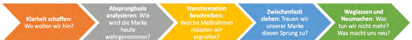
Abb. „In 5 Schritten die Basis einer erfolgreichen Umpositionierung schaffen“

In einer Phase der Umpositionierung bzw. zunächst einmal der notwendigen Vorüberlegung sind der bestehende Markenkern und die umliegenden Werte der Marke ein wesentlicher Bestandteil der Analyse und ein guter Grundindikator: Bleiben Markenkern und Markenwerte weitgehend bestehen, sind die Vorzeichen für eine gelungene Umpositionierung gut.