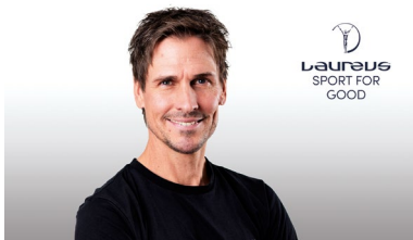
Felix Gottwald Österreichserfolgreichster Olympiasportler

Wachstum zu diskutieren. In diesem Jahr können sich alle Teilnehmerinnen und Teilnehmer auf diese spannenden Gäste freuen: