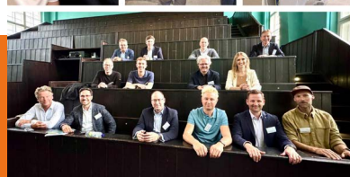
zu Gast in der Charité, Berlin