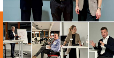
zu Gast bei Ausbüttel, Dortmund