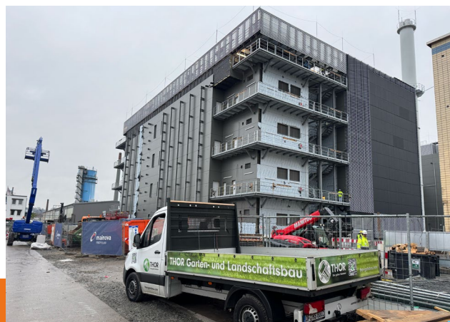
Das Mandat Programm zur Produktivitätssteigerung deckt Potenziale auf – vor Ort und direkt im Geschehen.