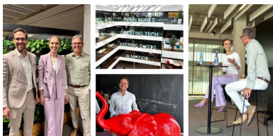
zu Gast bei AEB, Stuttgart