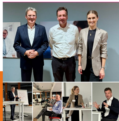
zu Gast bei Ausbüttel, Dortmund