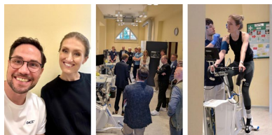
zu Gast in der Charité, Berlin

Registrieren Sie sich HIER für den kostenfreien Newsletter, um über alle neuen Termine informiert zu werden.