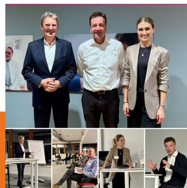
zu Gast bei Ausbüttel, Dortmund