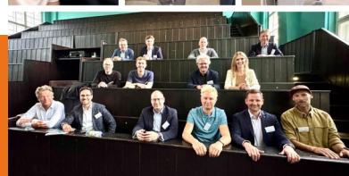
zu Gast in der Charité, Berlin