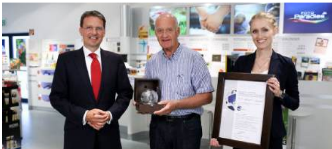
Der Gewinner des 2. Awards 2013: Prof. Götz W. Werner (†) , Gründer der dm-drogerie markt GmbH + Co.KG