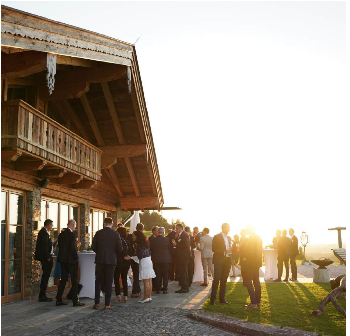
Empfang aller Gäste zum gemeinsamen Award-Abend.